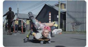
Exemples de films sélectionnés lors des précédentes sessions. Détail de la programmation disponible en septembre (Coups de cœur) et novembre (En attendant Noël).